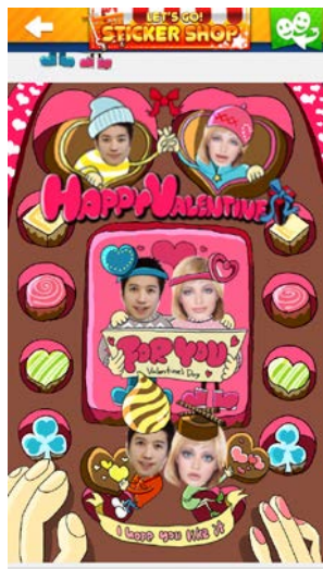
『チョコでラブな俺ら』