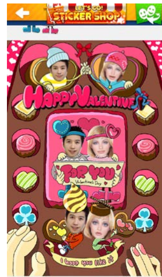
生成されたスタンプから、 送りたいものを選択