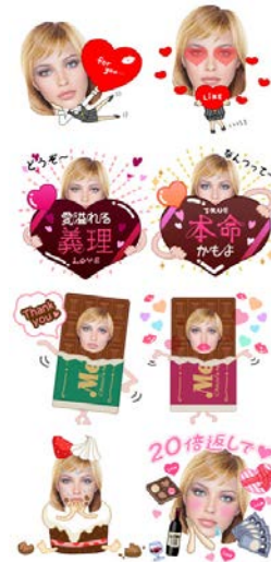
『義理義理バレンタイン』